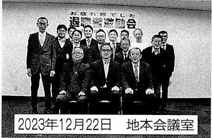
2023年12月22日 地本会議室