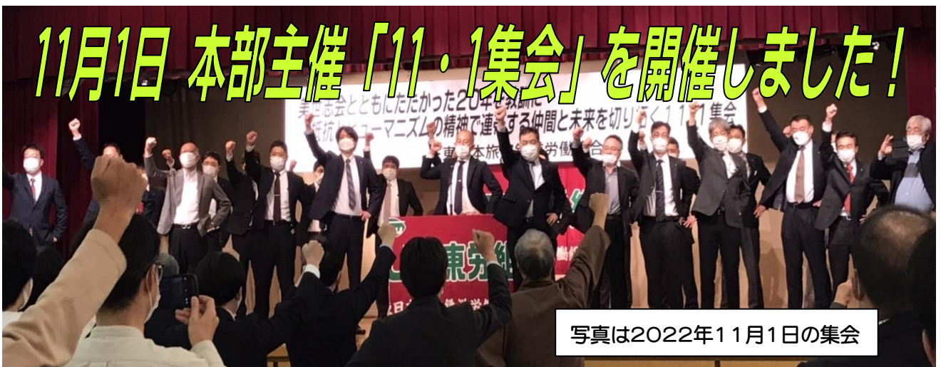
写真は2022年11月1日の集会

不当弾圧から21年！これからも美世志会と共にえん罪のない、平和で暮らしやすい社会を私たち一人ひとりから創り出すぞ！