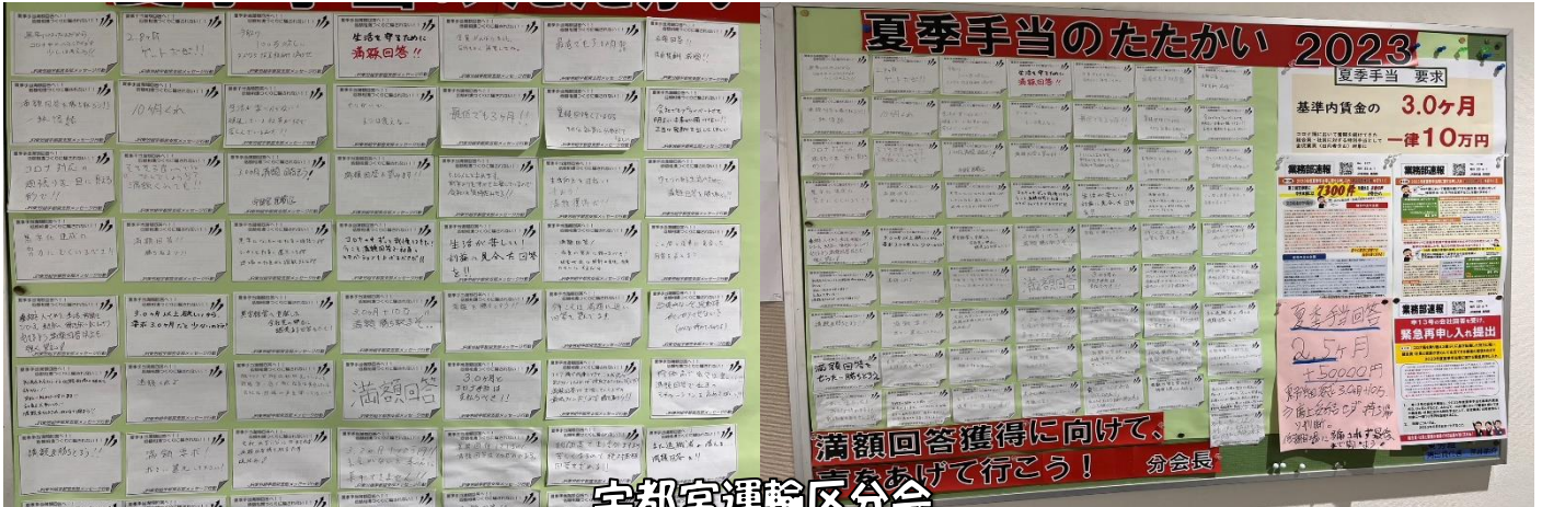
宇都宮運輸区分会

私たちが納得できる回答を職場から求めるぞ！ 【6月9日「緊急再申し入れ交渉」に向けて職場でたたかいを展開中】