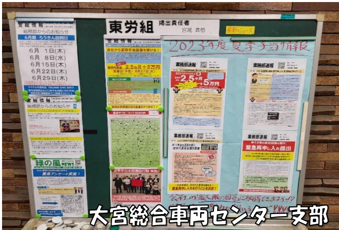
大宮総合車両センター支部