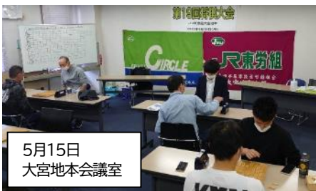
5月15日 大宮地本会議室