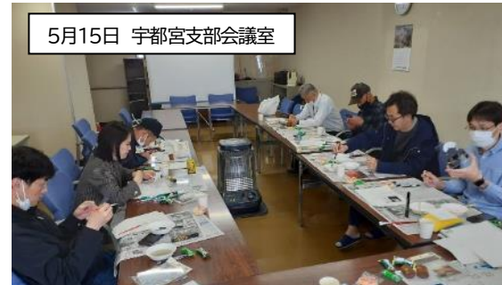
5月15日 宇都宮支部会議室

5月15日、大宮地本絵画部は宇都宮支部会議室において「第1回アクリルアート大会」を9名の仲間の参加で開催しました。絵画部としてこの間、活動が出来ていなかった課題がありました。総会を開催し組合員の意見からアクリルアート大会を開催することが出来ました。アクリルアートはアクリル板に絵を描き、色を塗って作成をしますが、誰一人として経験が無い中で全員四苦八苦しながら作品を創りました。参加者からは「初めてで苦労したが楽しかった」「みんなで作成するのもおもしろい」など感想が出され、最後は投票で素晴らしい作品を決定し、賞を授与するなど