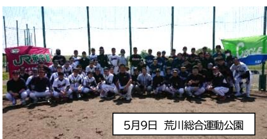
5月9日 荒川総合運動公園

9月に盛岡で開催される本部野球大会には、宇都宮運輸区分会とさいたま運転区分会の2チームが大宮地本を代表して参加する事になりました。次回の第23回大会