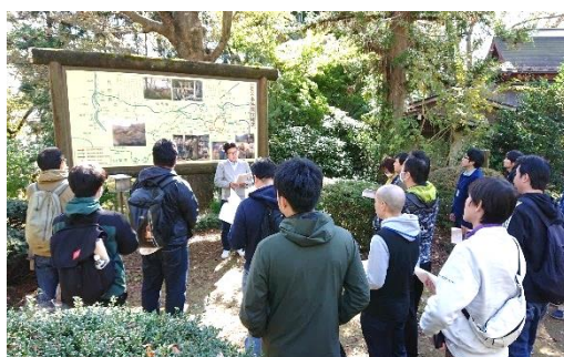
▲以前開催された「秩父困民党・風布地区研修」

開催日 12月6日 集合場所 熊谷駅南口前 集合時間 8時50分 参加費 3,000円 参加締切 11月28日 ★参加希望者は職場の役員まで