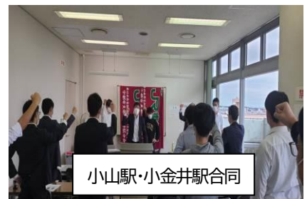
小山駅・小金井駅合同