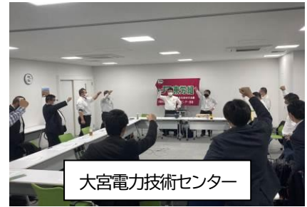
大宮電力技術センター