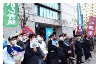
▲11月19日に開催された「19日行動」

いかなる戦争にも反対し、 命と暮らしを守る政治を現 現させる行動を推し進めて いきましょう！ ※開催時間は曜日により 変わるため、別途指示 となります。